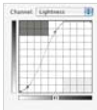
Obrázek 3.2 Změny v kanálu L ovlivňují kontrast, ne barvu. (Nahoře, A) Vylepšení kontrastu pomocí znázorněné křivky. (Dole, B) Zostření aplikováním filtru Unsharp Mask (Doostřit) na kanál L.

• Dále zkontrolujte paletu Info (Informace), kterou otevřete pomocí Windows > Info (Okna > Informace), viz obrázek 3.5. Její horní polovinu lze nastavit tak, aby ve dvou sloupcích zobrazovala současně hodnoty ve dvou barevných prostorech, což je velmi praktické. Nastavení každého sloupce se ovládá zvlášť kliknutím na příslušné kapátko. Levý sloupec by měl zůstat na výchozím nastavení Actual Color (Platný režim), což znamená, že při práci v LAB se zobrazí LAB hodnoty, při práci v RGB se zobrazí RGB hod-