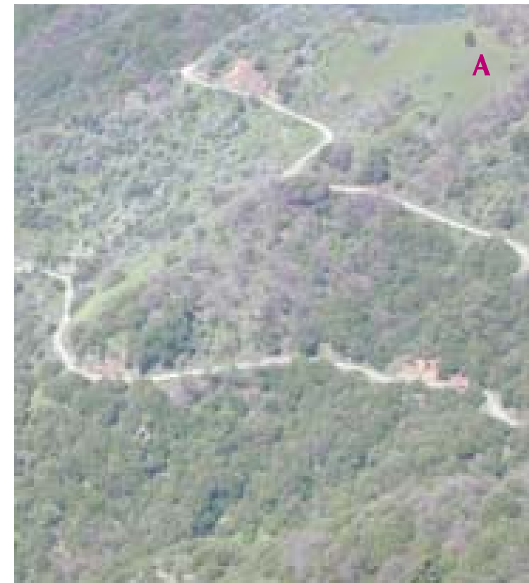
Obrázek 3.3 (Nahoře) Obraz po úpravě pouze kanálu A. (Dole) Obraz po úpravě pouze kanálu B.

Když použijete tato nastavení RGB a CMYK, bude vám paleta Info (Informace) hlásit podobné hodnoty, jako jsou v knize, i když se mohou mírně lišit v závislosti na některých jiných nastaveních. Jinak bu-