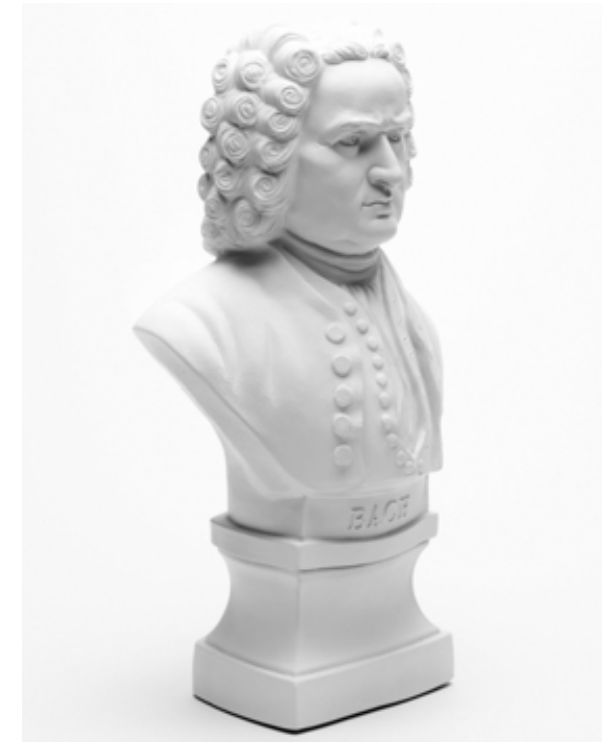
9.14 Vidíme dobré rozlišení bočních okrajů předlohy od pozadí. Avšak horní část hlavy zmizela.