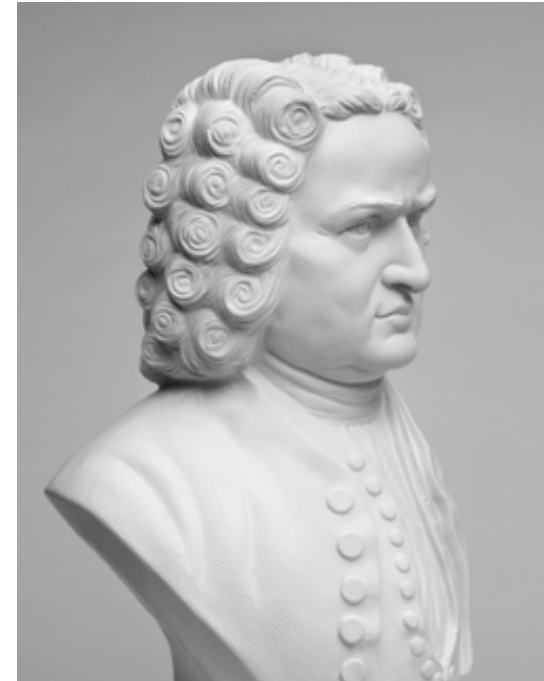
9.12 Pozadí je nyní světle šedé a busta se zdá být bílá. Z mozku nyní dostaneme zrakovou zprávu, že se jedná o bílou na šedé a nikoli o bílou na bílé.

Na druhou stranu z psychologického hlediska to tak moc jedno není. Obrázek 9.11 ukazuje bílou předlohu proti bílému pozadí. Obraz jsme svítily tak, aby bylo pozadí bílé a předloha světle šedá. Když se na obrázek podíváte, váš mozek ho bude interpretovat jak bílou na bílé.