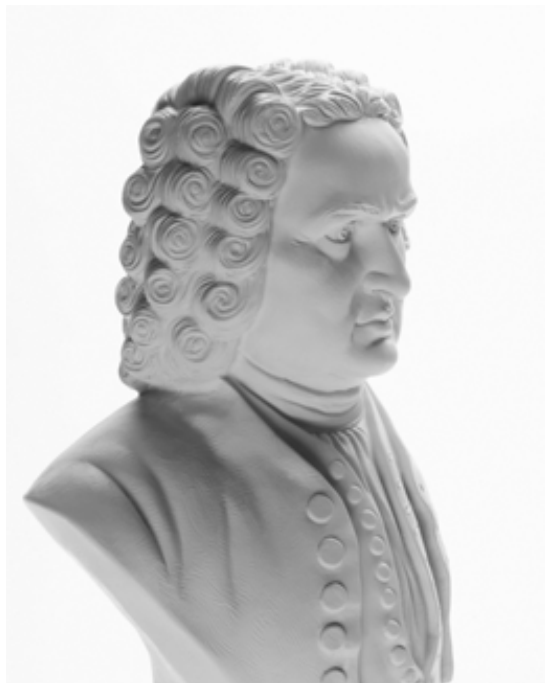
9.11 Pozadí vypadá bíle a Bachova busta je světle šedá. Mozek interpretuje tento obraz jako bílou na bílé.

Můžeme osvítit buďto pozadí nebo okraje předlohy tak, aby vypadaly na fotografii bílé nebo velmi světle šedé. Když rozhodneme, která z dvou možností (pozadí nebo předloha) bude na fotografii bílá, víme, že ta druhá musí být trochu tmavší. Po technické stránce je úplně jedno, zda má být trochu tmavší fotografovaný předmět nebo pozadí. Každá možnost zajistí rozlišení v odstínech.