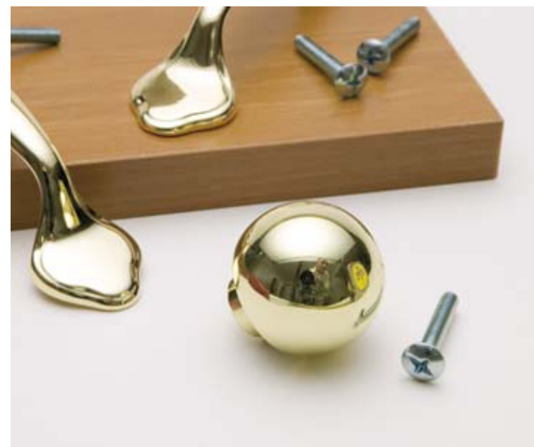
6.30 Obecný problém v podání kulatého kovu.

Maskování také poskytnou jiné předměty dodané do záběru. Odrazy předmětů obklopujících kovovou předlohu mohou rozbít