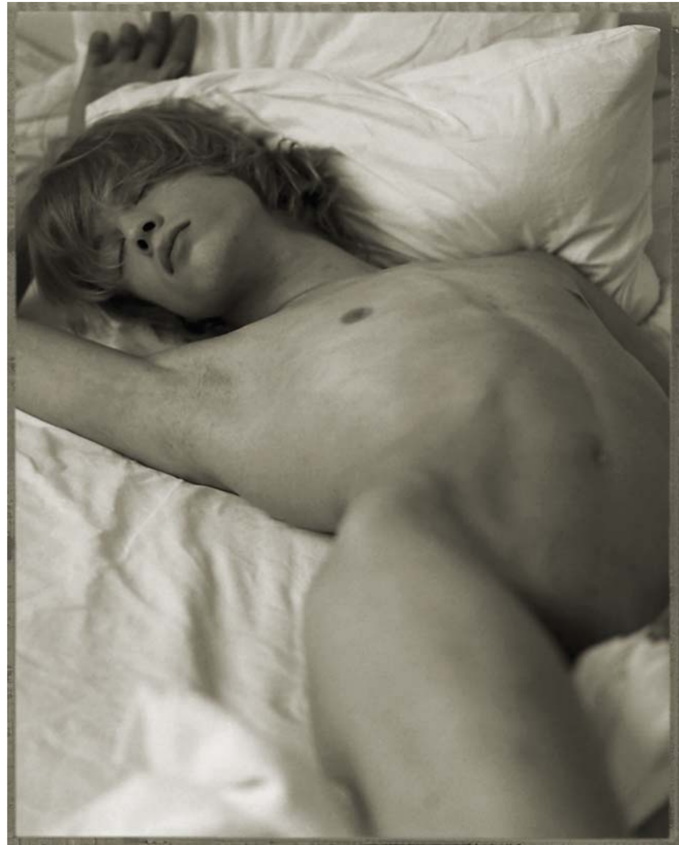
► Dreams 1, Praha 2002