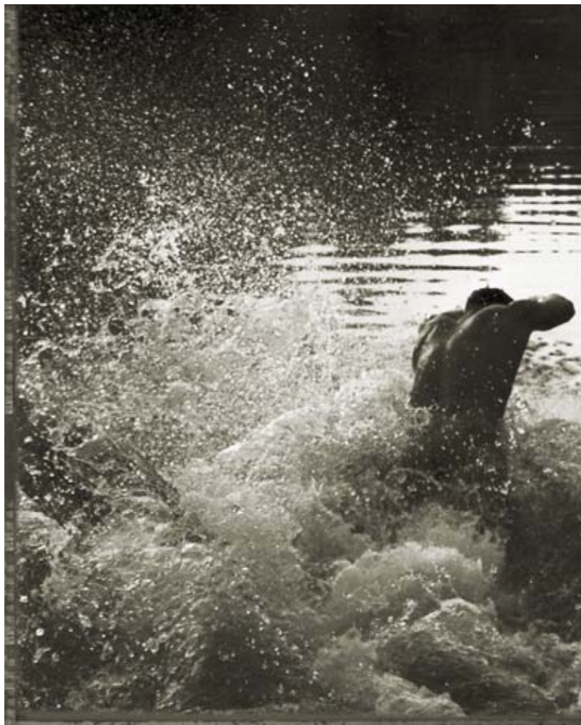
◀ Adršpach 1 a 2, 1992