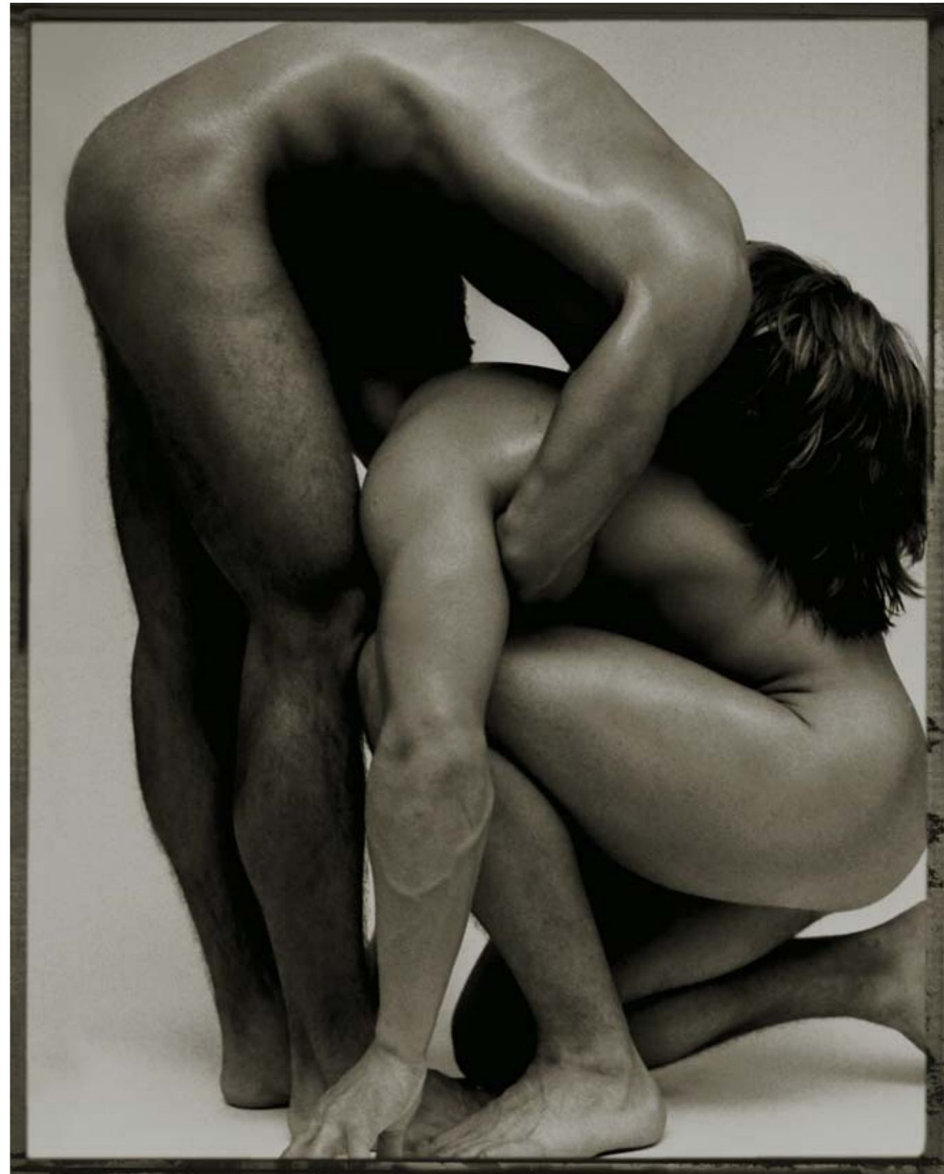
▶ Ty a já, Praha 1995